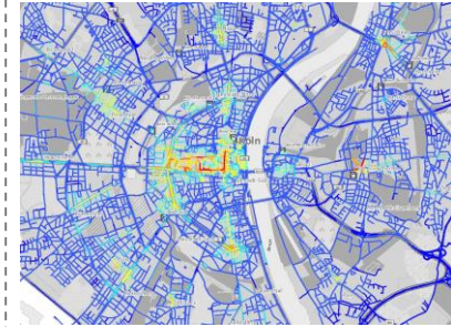
Beispiel Köln, Zoom Out

Flächendeckende Klassifikation von Straßenabschnitten