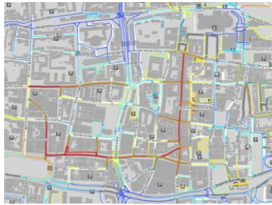
Beispiel Köln, Zoom In